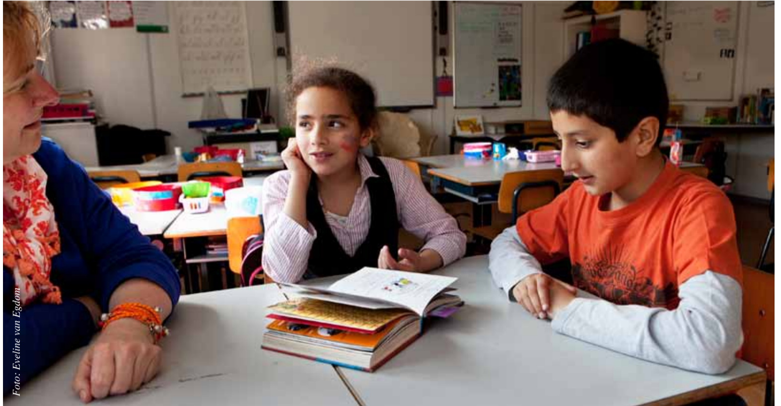
Leidsters en leerkrachten weten wel wat goede interactievaardigheden zijn, maar het is een hele klus om die in praktijk te brengen.

Overigens betwijfelt Damhuis of professionals zelf voldoende interactievaardigheden in huis hebben om gespreksvaardigheid bij kinderen te stimuleren. "Ze wéten vaak wel wat goede interactievaardigheden zijn, maar het is een hele klus om die in praktijk te brengen. Vaardigheden om taalproductie uit te dagen heb je niet zomaar, die moet je opbouwen, ondersteund door coaching."